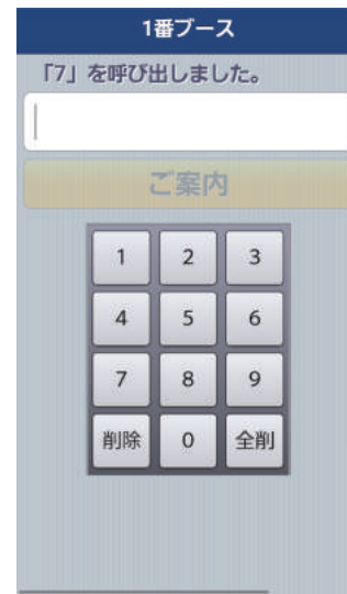
ご案内番号表示機

③サーバーと接続されているスピーカーからご案内音声流れ、ご案内表示機にご案内番号が表示されます。